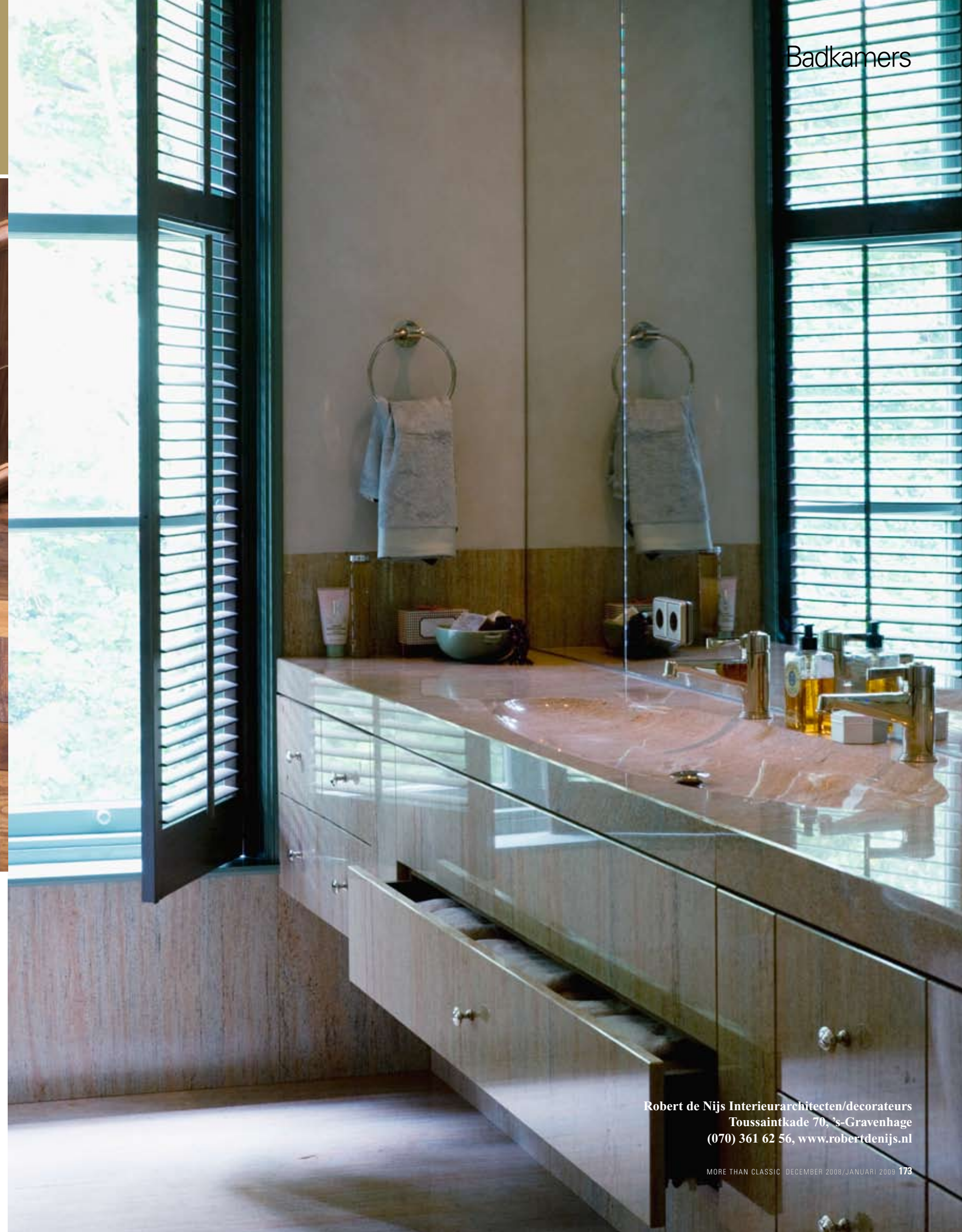
Linksboven De douchearmaturen zijn afkomstig uit de nieuwe Paris Faubourg-collectie van THG, een ontwerp van Pierre-Yves Rochon, € 1.777 (Dinline). De handdoek, € 30, is van Co van der Horst. Nog net te zien: bad Evolution van Aquamass, € 3.866 (Dinline). Rechtsboven De gebogen kastdeuren en het legpatroon van de vloer zijn fraaie staaltjes vakmanschap. Rechterpagina Wanden, vloer en wastafelmeubel zijn vervaardigd uit Ivory Brown-marmer. Wastafelkranen 6500 komen uit de Paris Faubourg-collectie van THG, € 1.025. Middels shutters kan het daglicht naar believen worden gefilterd (Euroshutters).

Robert de Nijs Interieurarchitecten/decorateurs Toussaintkade 70, 's-Gravenhage (070) 361 62 56, www.robertdenijs.nl